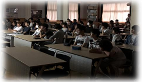
みんな真剣に聴いていました