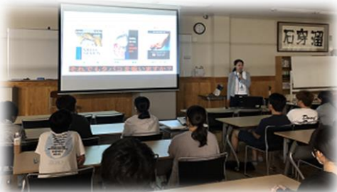
興学館で行いました