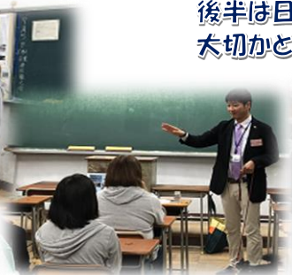
本物の犬を使っでの実習