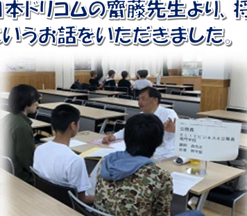
公務員試験について学ぶ