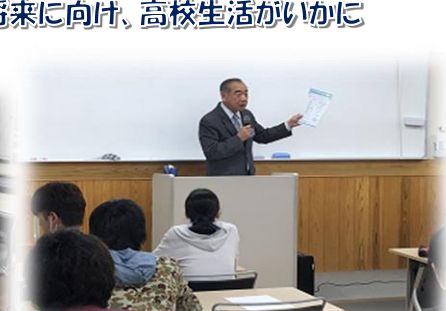
前藤先生の熱い講話を聴きました